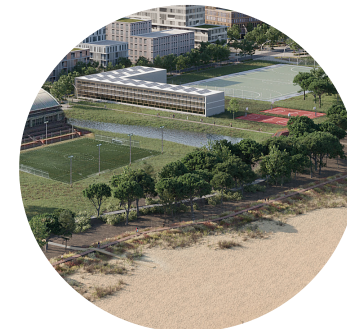
SUDS i superfícies drenants