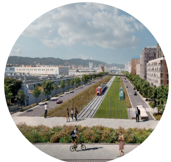
Reurbanització costat mar (Av. Eduard Maristany)