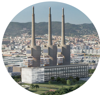
Catalunya Media City