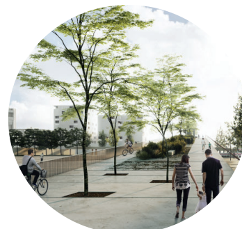
Passarel·les i passos inferiors