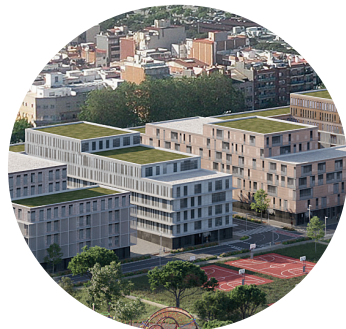
Edificació amb criteris sostenibles