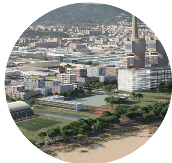
Parc litoral i verd urbà