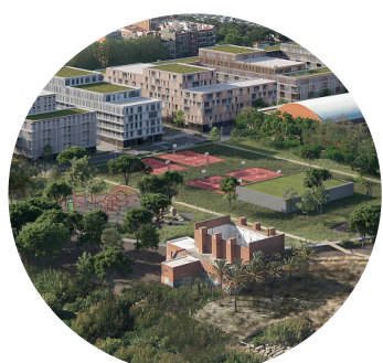
Trasllat pistes esportives